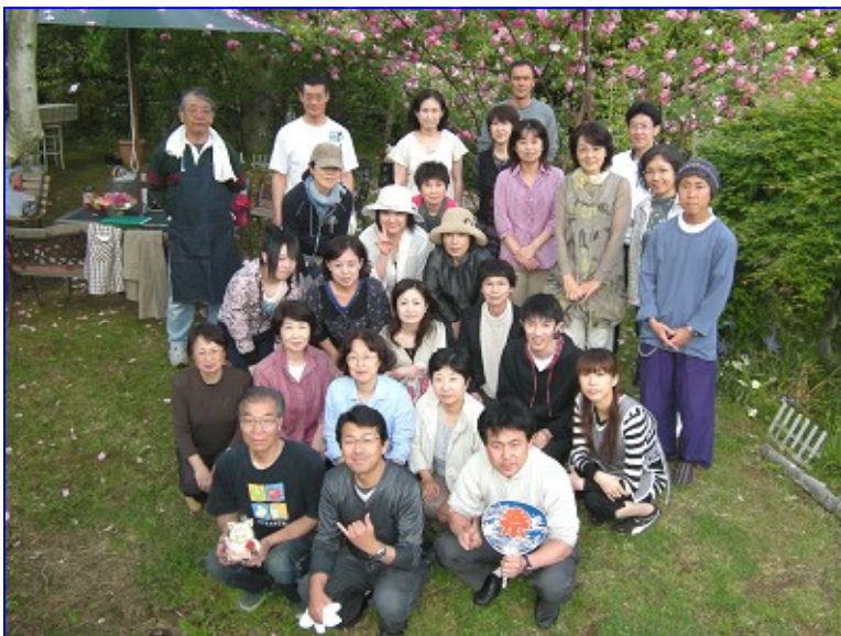
参加者の皆さん（総数30名）