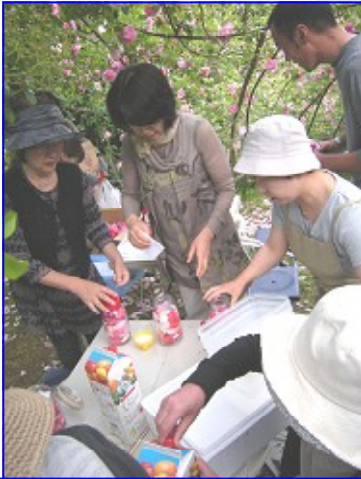
ローズリキュールの調理風景