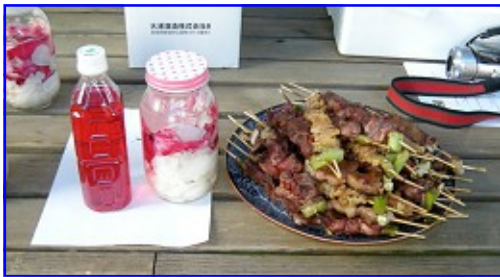
見事なできばえ（左から）ばらジュース、ばらリキュール、大評判のやきとりでした。