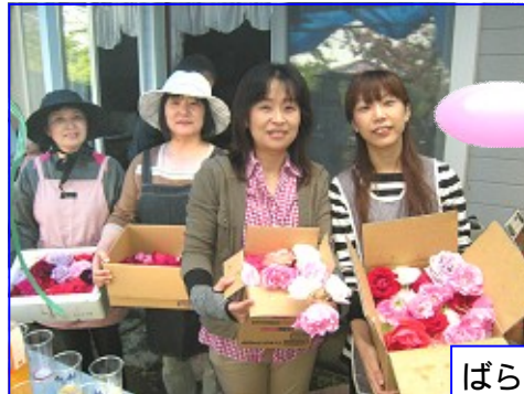
ばら風呂用のばらです。