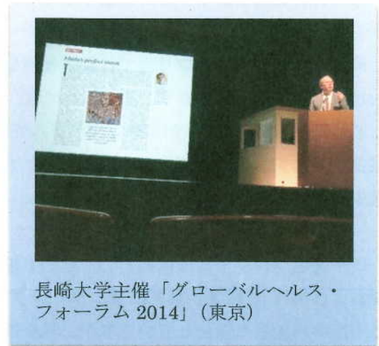
長崎大学主催「グローバルヘルス・フォーラム2014」(東京)

最後になりますが、私の回想録『No Time to Lose』の日本語版が2015年前半に慶應義塾大学出版会から刊行されますので、日本の皆さんにも手に取っていただきやすくなると思います。