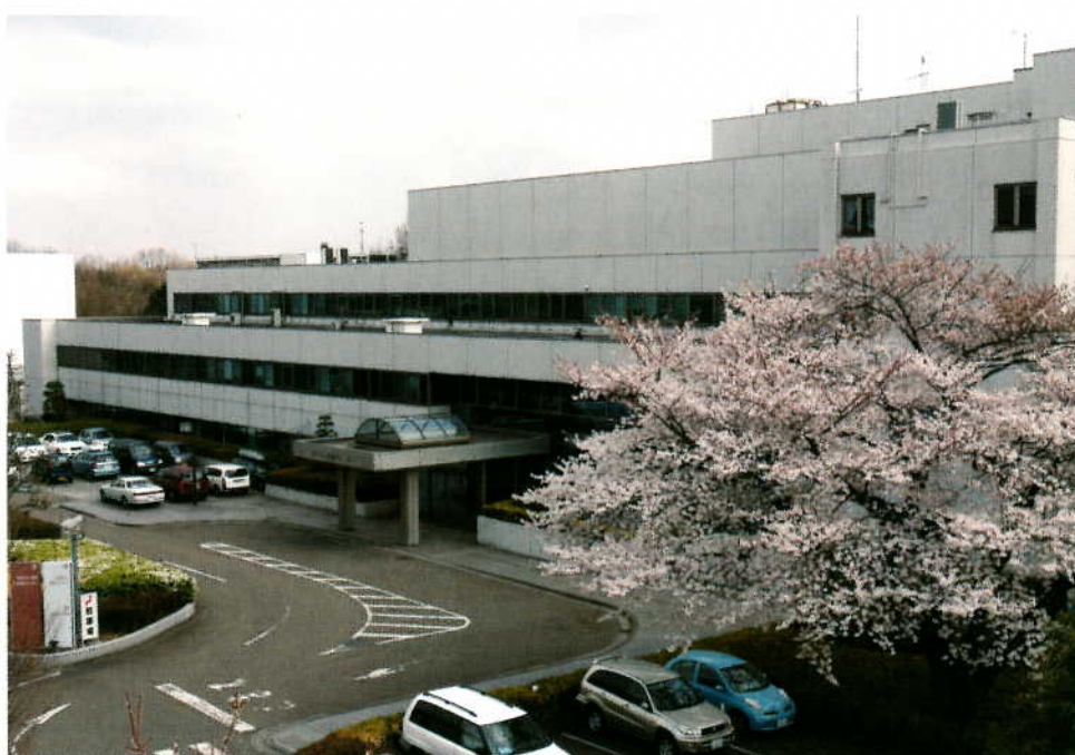
東京都がん検診センター

公益財団法人 東京都保健医療公社 東京都がん検診センター (日本臨床細胞学会認定細胞検査士養成所)