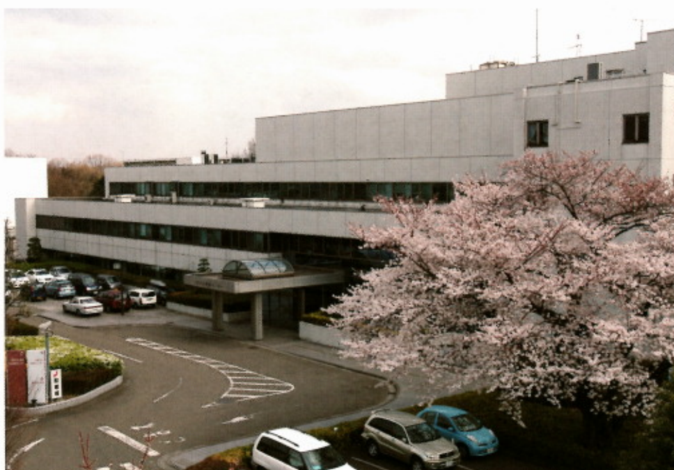
東京都がん検診センター

財団法人 東京都保健医療公社 東京都がん検診センター (日本臨床細胞学会認定細胞検査士養成所)