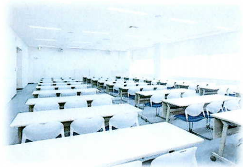
研修会 会場コラッセふくしま4F 中会議室(401)