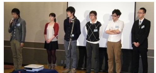
新入会員の皆さん