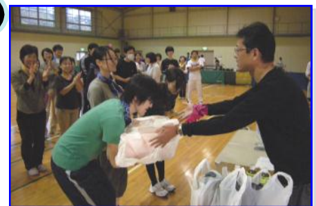
表彰式 準優勝 共立Bチーム