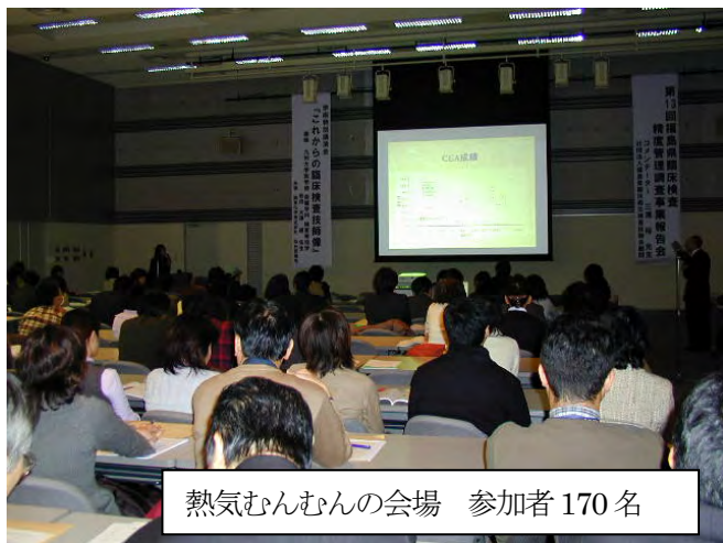
熱気むんむんの会場 参加者 170名