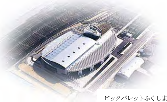
ビックパレットふくしま