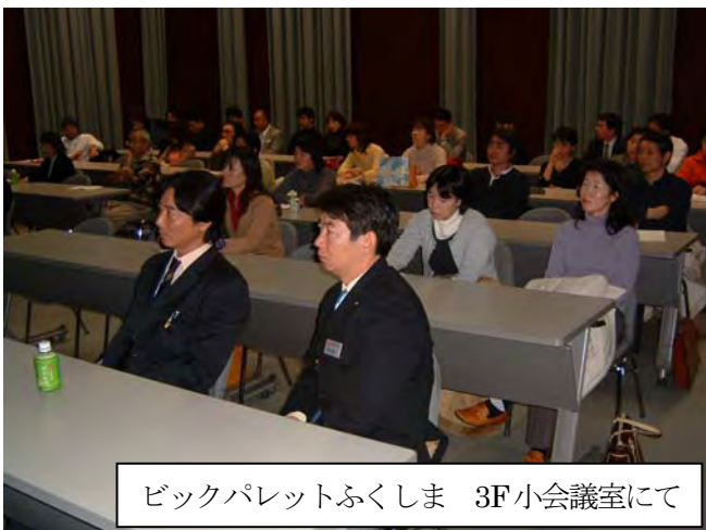
ビックパレットふくしま 3F小会議室にて